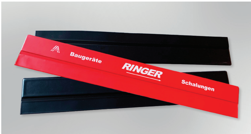
Musterbeispiele für selbstklebende färbige Kalenderleisten