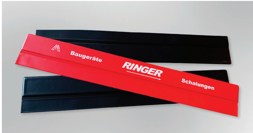
Musterbeispiele für selbstklebende färbige Kalenderleisten